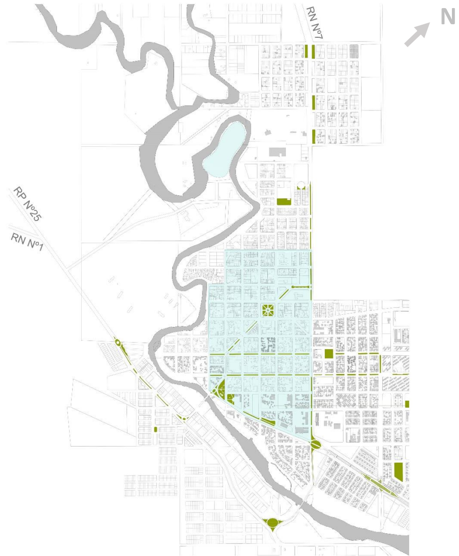
Plano Centro Cívico de la Ciudad de Rawson