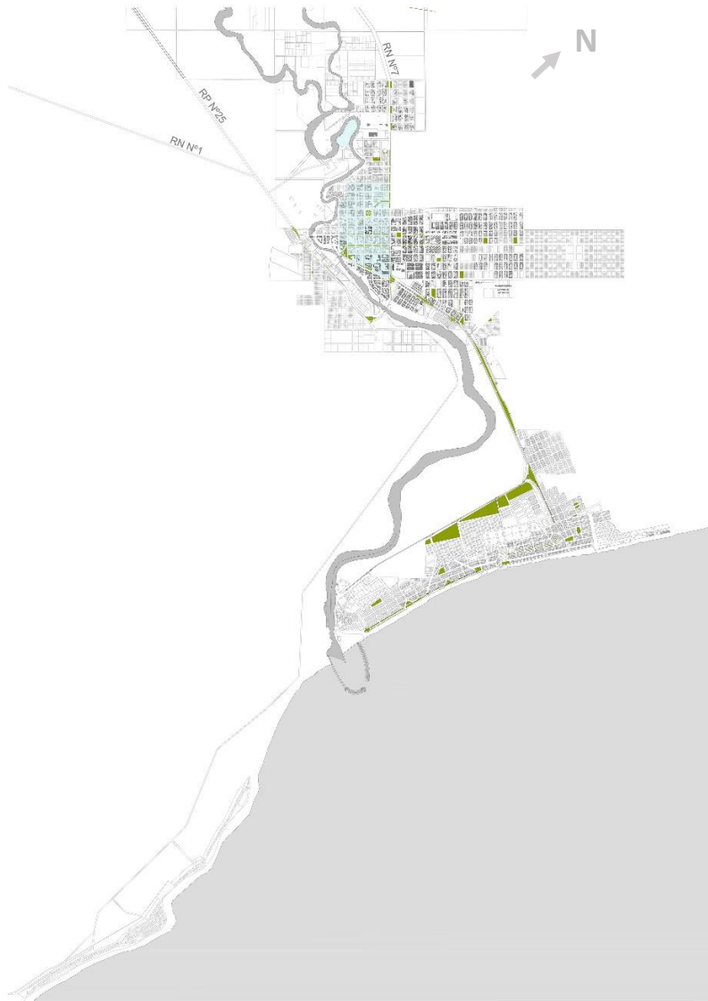
Plano General de la Ciudad de Rawson